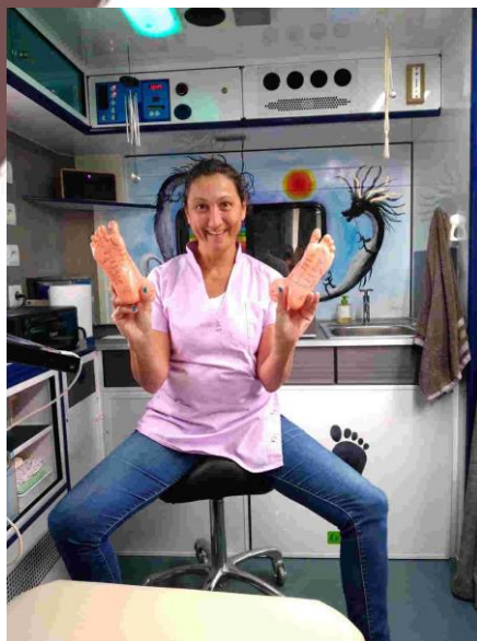
Le Pied Zen